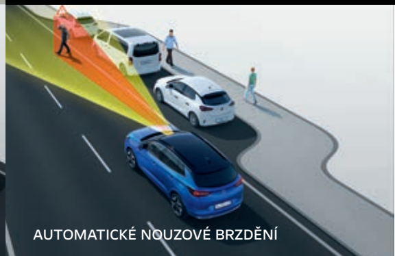
AUTOMATICKÉ NOUZOVÉ BRZDĚNÍ