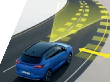
ASISTENT PRO JÍZDU V PRUZHÁCH A UPOZORNĚNÍ NA VYJETÍ Z PRUHU

Opravdový luxus netkví jen ve velkorysém interiéru, ale v celkovém klidu na řízení, který vám nový Grandland poskytuje prostřednictvím řady inovativních technologií. Cestujte bezpečněji a plynuleji díky Adaptivním předním světlometům IntelliLux LED Pixel, automatickému nouzovému brzdění, nočnímu vidění, přední a zadní kameře, asistentu pro jízdu v pruzích, upozornění na vyjetí z jízdního pruhu, asistentu pro jízdu na dálnici, pokročilému parkovacímu asistentu a mnoha dalším pokročilým funkcím.