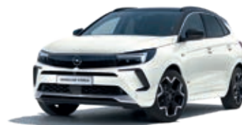
Bílá White Jade