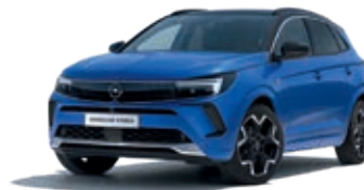
Modrá Vertigo Blue