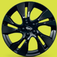
18" ráfky z lehkých slitin