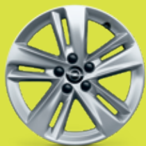
17" ráfky z lehkých slitin