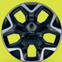
19" ráfky z lehkých slitin