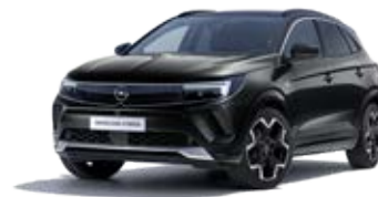
Černá Diamond Black