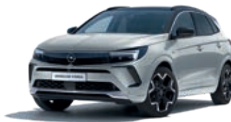
Šedá Quartz Grey