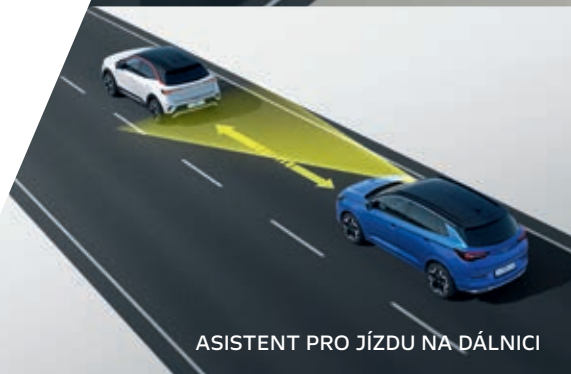
ASISTENT PRO JÍZDU NA DÁLNICI