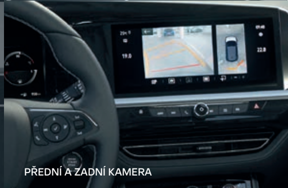
PŘEDNÍ A ZADNÍ KAMERA