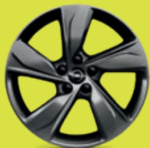
18" ráfky z lehkých slitin