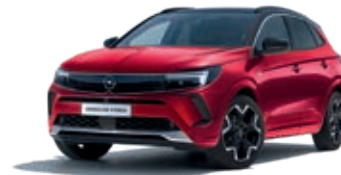
Červená Ruby Red