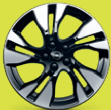
18" ráfky z lehkých slitin